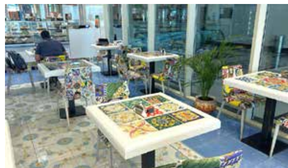
Piastrille per i tavoli del ristorante Mamma Sicilia a Dubai