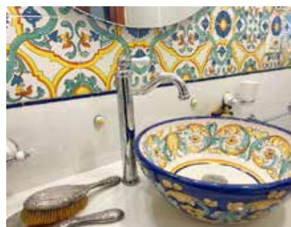
Bagni per l'hotel Milton a Jesolo

Gli Showroom: La sede principale de Il Rustico Ceramiche Giraffa è a Caltagirone, ma negli anni l'azienda ha aperto showroom in città come Taormina, Cagliari, Valenza, Giardini Naxos, Marina di Ragusa, Portopalo di Capo Passero, Marzamemi, Margherita di Savoia, Licata e, attualmente aperto, ad Agrigento. Spazi in cui tradizione artigianale e design si fondono, offrendo cucine e bagni in muratura, top e tavoli in pietra lavica decorata e gazebi da esterno personalizzabili. Oggi il brand guarda oltre i confini nazionali e lavora a nuovi progetti anche negli Stati Uniti, all'interno di concept store dedicati al made in Italy.