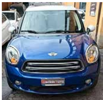
MINI COOPER CONTRYMAN, CC. 1.6, ANNO 04.2016, SW, € 9.800,00 USATO GARANTITO BUSCEMI AUTO TEL. 0933.51554

MINI CONTRYMAN , cc.2.0, 143cv, cooper, colore nero, anno 10/2013, € 9.780,00 AMATO MOTORS INSURANCE TEL. 0933/28203